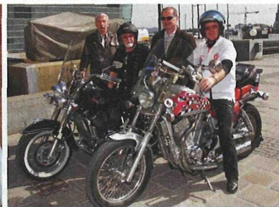
PENSI-BIKER. Sie gehören nicht zum alten Eisen: die Pensionisten und ihre Maschinen.